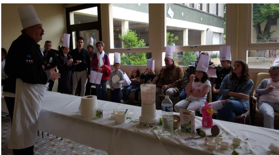
Pour les enfants : dégustations de smoothies aux herbes, aux orties ...