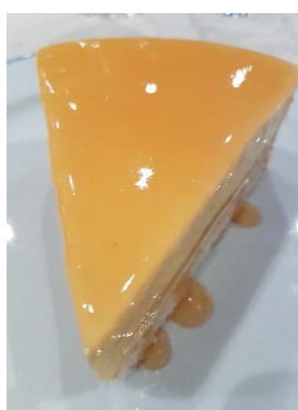
Mousse citron passion

Kir Crémant ; Château Gravelines (Bordeaux blanc sec 2015) ; Domaine Labarthe (Gaillac 2012)