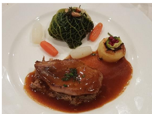
Poule faisane en deux cuissons