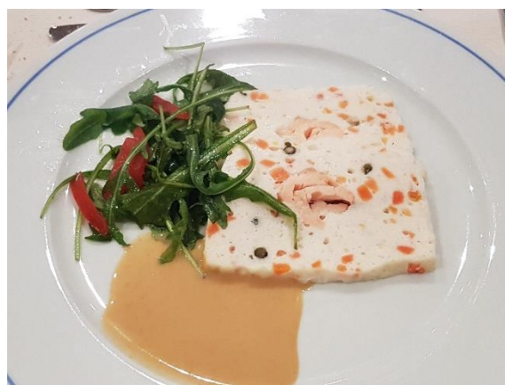
Terrine de sandre et saumon