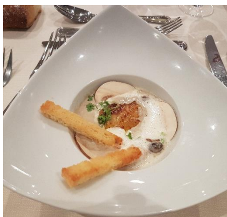
Velouté de champignons

Le menu confectionné et servi par les élèves du Lycée René Auffy a délecté les papilles des convives :